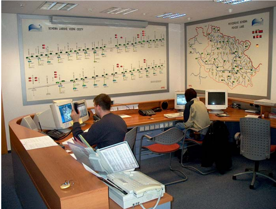
Obr. 1 - dispečerské pracoviště VHD dispečinku Povodí Labe, s.p.

Vodohospodářský dispečink (VHD) Povodí Labe, s.p. je rozdělen na uzavřenou interní (intranetovou) a veřejnou (internetovou) část. Do interní části dispečinku mají přístup pouze zaměstnanci společnosti Povodí Labe, s.p. Každý uživatel VHD dispečinku má přiděleno oprávnění do které části dispečinku může přistupovat a zda vybranou technologii může i povelovat.